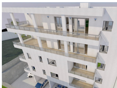
2 KAT- APARTMAN S7