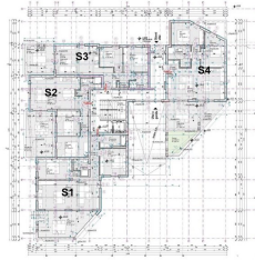
PRIZEMLJE GROUND FLOOR