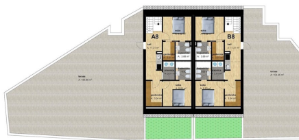
Půdorys 3. patra