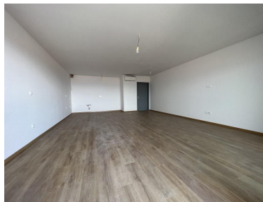
5 patro, apartmán A7