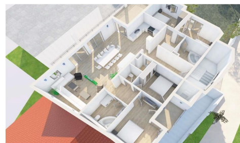
2 KAT- APARTMAN S7