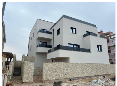
Vyřizuje: Violeta Borisova