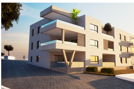
2.KAT 2nd FLOOR