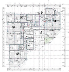
PRIZEMLJE GROUND FLOOR