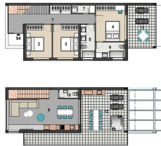
VIŠESTAMBENA ZGRADA, TKON