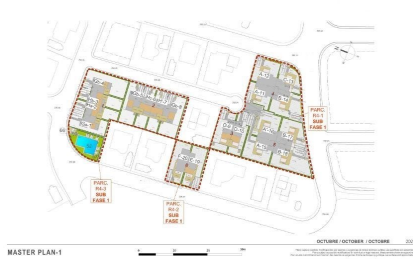
MASTER PLAN 1