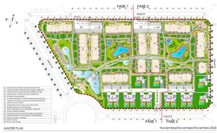
Plánek celého areálu